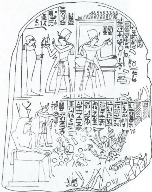
Стела Хильдсайма: церемония вручения подарков Мусе, ответственному за военных писцов при Раамсесе 2м.