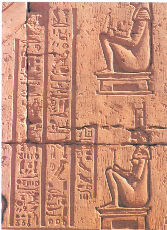
Барельеф, на котором богиня Исис сидит в позе роженицы на родильных камнях, Храм Кум-Умбо

В Шмот 1: «(13) И поработили Египтяне сынов Исраэлевых тяжелой работой. (14) И делали жизнь их горькою трудом тяжелым над глиною и кирпичами и всякими полевыми работами, всякою работою, к которой принуждали их с жестокостью». Среди перечисленных работ к которым принуждали евреев были полевые работы. Полевые работы считались в Египте наиболее тяжелыми работами. Папирус Ленсинга из британского музея (9994), который использовался как учебное пособие подчеркивает: «Те, которые выходят на полевые работы – это самая тяжелая работа из всех работ». Этот и другие тексты описывают страдания занятых на полевых работах. Замечание в Танахе: «всякими полевыми работами» выглядит невинно, но оно отражает египетские реальности и подчеркивает степень порабощения египтянами.